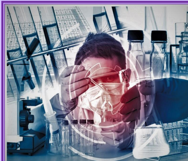
Die Virologen sollen in Zeiten von Corona die Rolle von Propheten und Schutzpatronen übernehmen.

Der gesamte Artikel kann auf der Homepage unserer Pfarrei www.pfarrei-villnoess.com weitergelesen werden.